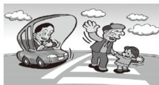
①歩行者に日本一やさしい山形県