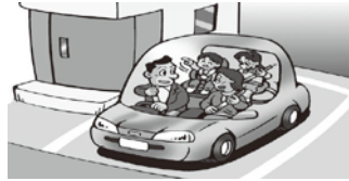
③全席シートベルト装着を確認